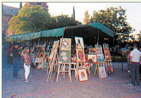
El fruto del trabajo realizado durante el año, es expuesto a consideración del público.

El ciclo 2006 comenzará el lunes 3 de abril en Avda. Gral. Roca 455 y las especialidades son las siguientes: Pintura Country, Telar, Tejidos, Manualidades, Velas y Jabones, Cerámica Indígena, Corte y Confección, Pintura en Tela y Porcelana en Frío.